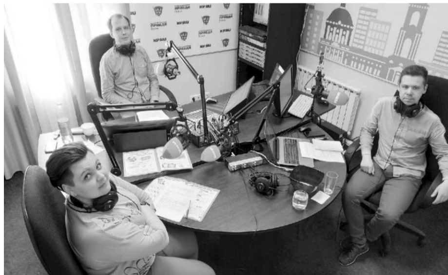
Во время эфиров на радио «Комсомольская правда»

- Весной детский сад не работал. С конца марта до 15 мая не работал в очном режиме и я. С 15 мая у нас открылась дежурная группа. Мы продолжали реализацию образовательной программы с помощью дистанционных технологий - высылали